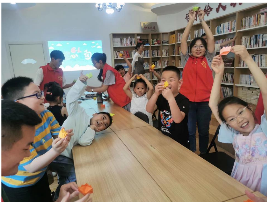
（团队成员同小朋友一起做手工）