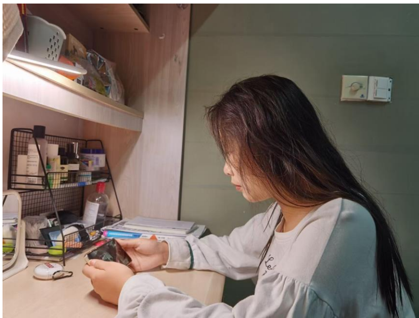
（团队成员进行低碳节能知识学习）

要参与低碳节能工作的成员手中，让他们进行低碳节能知识的了解和学习，提高活动必备的基本知识素养，为开展线下低碳节能工作做准备。