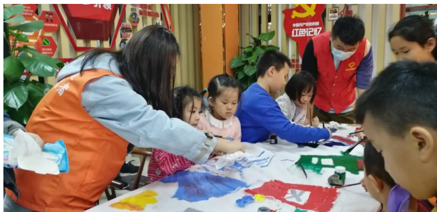
（团队成员同小朋友一起绘画）