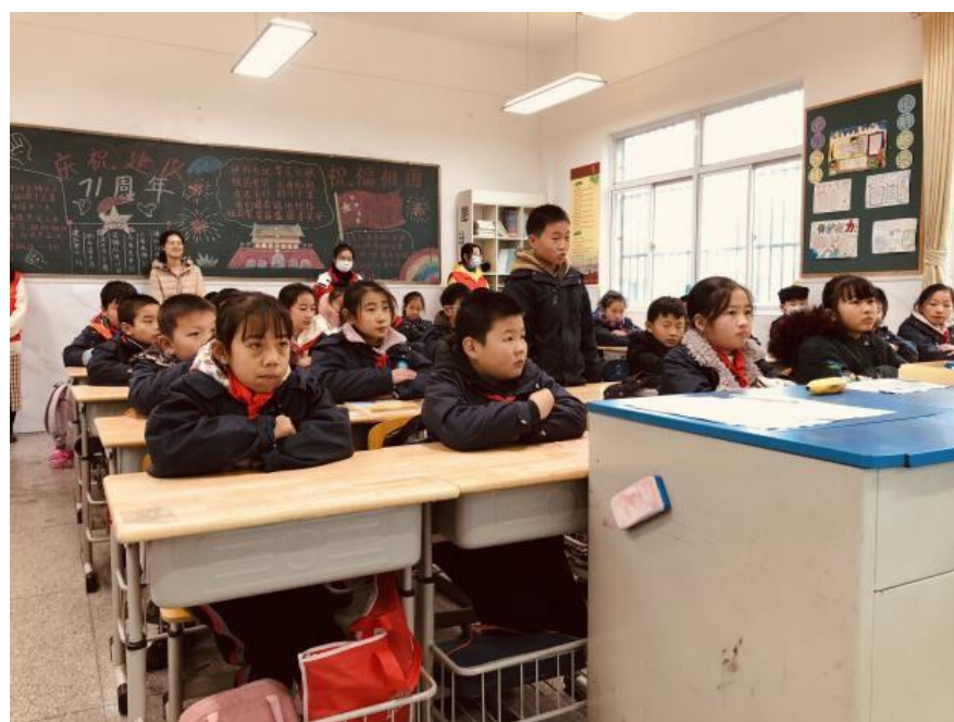
（团队成员给小朋友们上环保教育课）