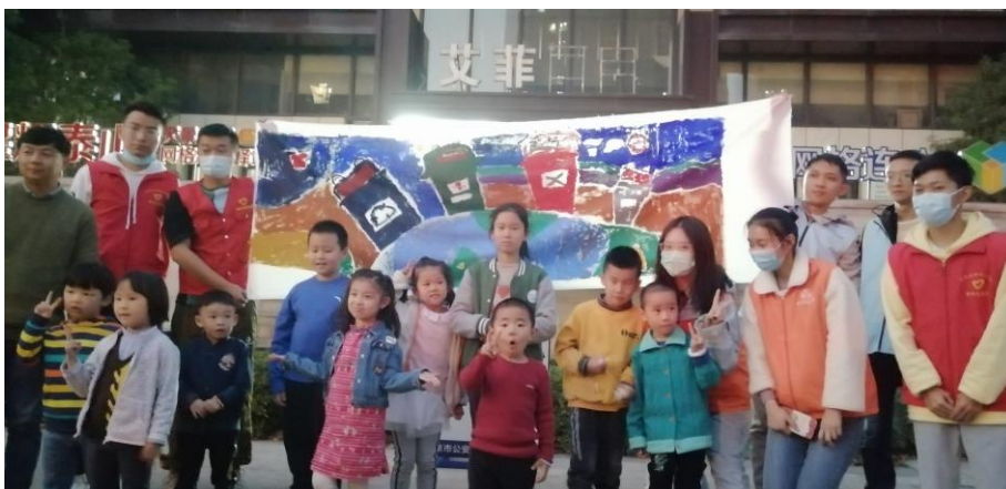
（团队成员和小朋友与手抄报合照）