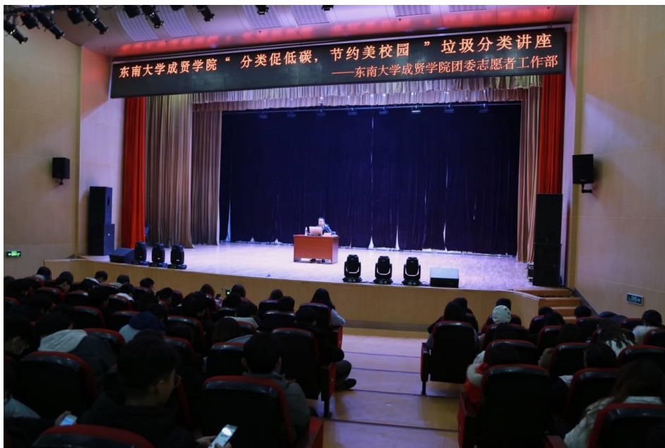
（主讲老师正给同学们普及垃圾分类相关知识）