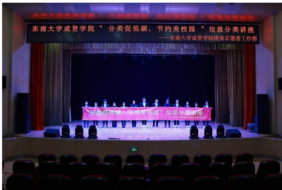
（团队成员合影留念）