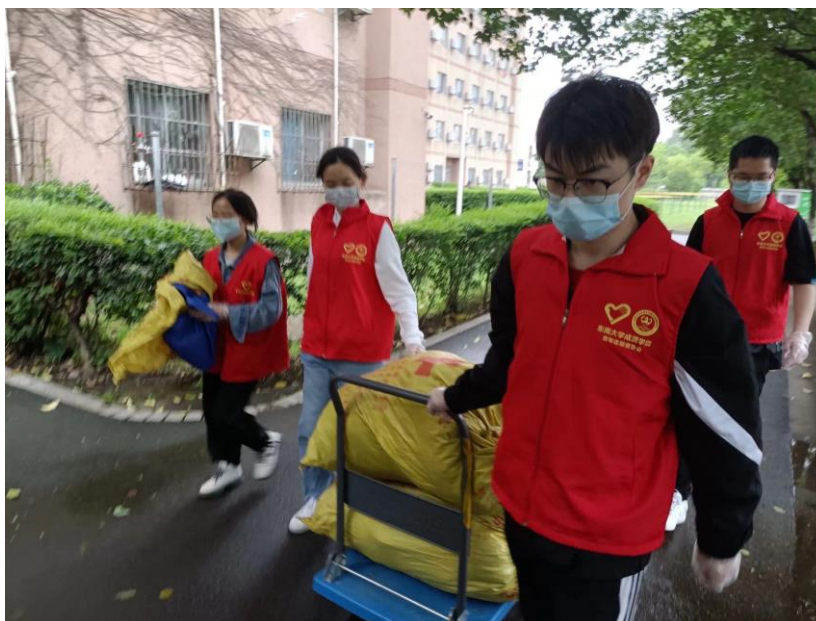
（团队成员运送收集到的废品）

D. 团队成员准备好有关低碳节能的环保教育知识 PPT，来到小学课堂上为小朋友们上环保教育课，给他们科普，丰富他们的知识。课后带着小朋友们一起做游戏，给卡片上的垃圾分分类，让他们在游戏中能学习到更多的知识。