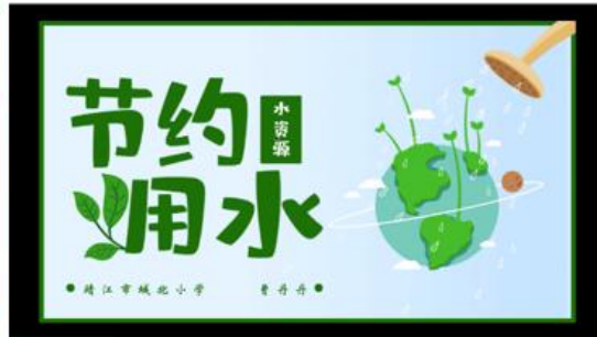
环保微讲座：一关于世界节水日，二现今水资源现状，三水资源的浪费破坏，四节约用水保护水源。